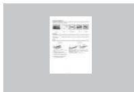
Краткое руководство по установке