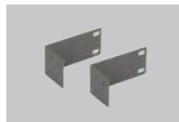
Кронштейны для установки в стойку